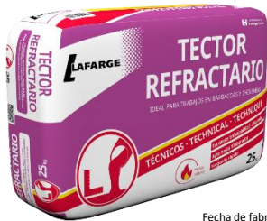
Fecha de fabricación y detalle del producto impreso en los laterales del saco