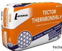
Fecha de fabricación y detalle del producto impreso en los laterales del saco

Tector® ThermioNivel A+ es el mejor mortero en base anhidrita de su clase.