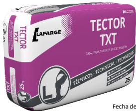
Fecha de fabricación y detalle del producto impreso en los laterales del saco