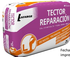
Fecha de fabricación y detalle del producto impreso en los laterales del saco